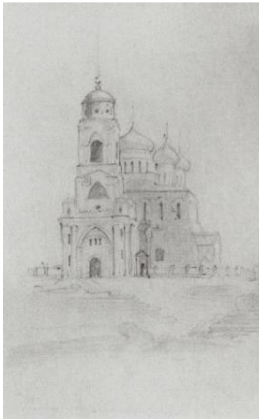
Рис. 1. В.Д. Поленов. Успенский собор во Владимире. 1860. Бумага, картон. 28×18. Государственная Третьяковская галерея, Москва