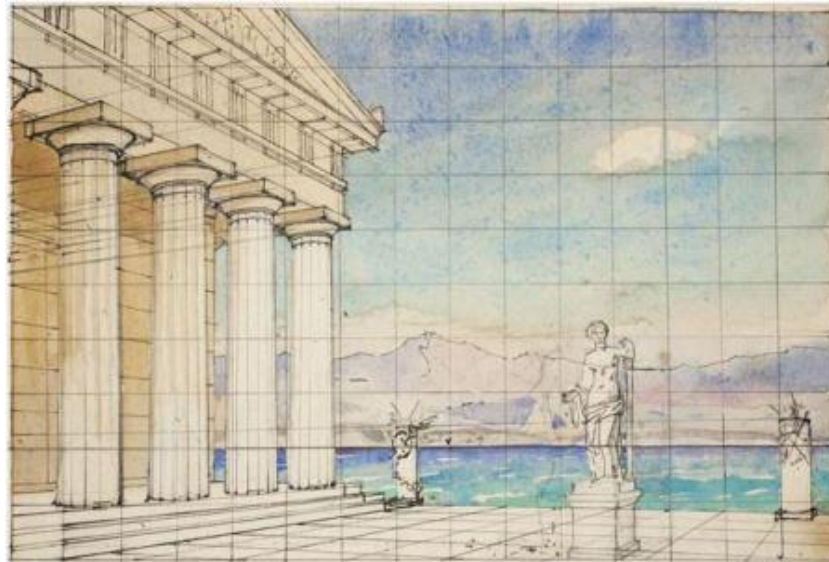
Рис. 5. В.Д. Поленов. Статуя Афродиты перед портиком храма. 1900-е. Рабочий эскиз декорации для оперы В.Д. Поленова «Призраки Эллады». Альбом В.Д. Поленова 1894, 1906 и 1900-х годов. Бумага, разграфленная на квадраты, акварель, тушь. 17,2×25,7. Государственный мемориальный историко-художественный и природный музей-заповедник В.Д. Поленова