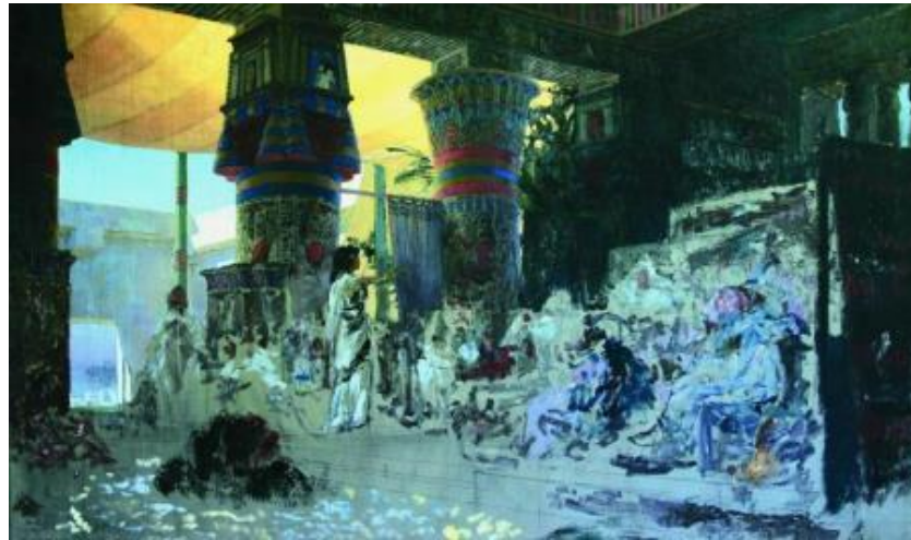
Рис. 6. В.Д. Поленов. Блудный сын. 1875. 148×250. Государственный мемориальный историко-художественный и природный музей-заповедник В.Д. Поленова