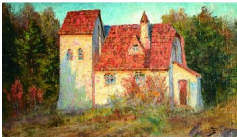
Рис. 9. В.Д. Поленов. Аббатство. Холст на картоне, масло. 28×49. Государственный мемориальный историко-художественный и природный музей-заповедник В.Д. Поленова