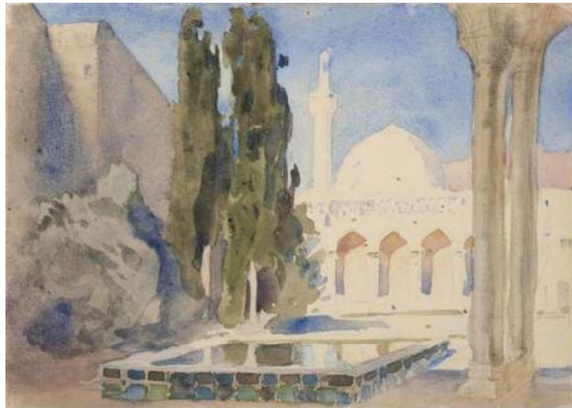
Рис. 7. В.Д. Поленов. Восточный дворец и сад. 1889. Эскиз декорации для постановки комедии С.И. Мамонтова «Чёрный тюрбан». Бумага, акварель. 17,5×24,5. Государственный мемориальный историко-художественный и природный музей-заповедник В.Д. Поленова