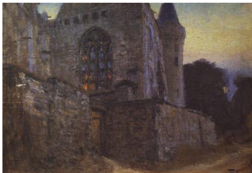
Рис. 3. В.Д. Поленов. Аббатство в Редоне. 1873-1876. Холст, масло. 23×34. Государственный Русский музей, Санкт-Петербург