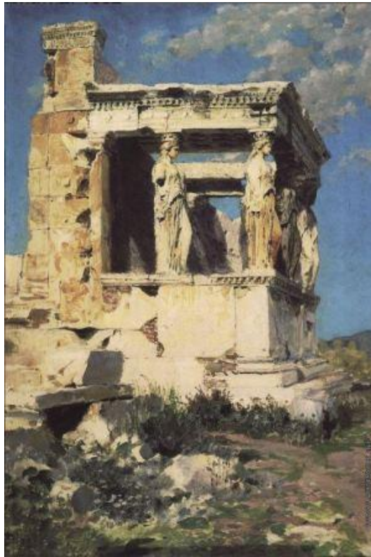
Рис. 4. В.Д. Поленов. Эрехтейон. Портик кариатид. 1882. Холст, масло. 40×27. Государственная Третьяковская галерея, Москва