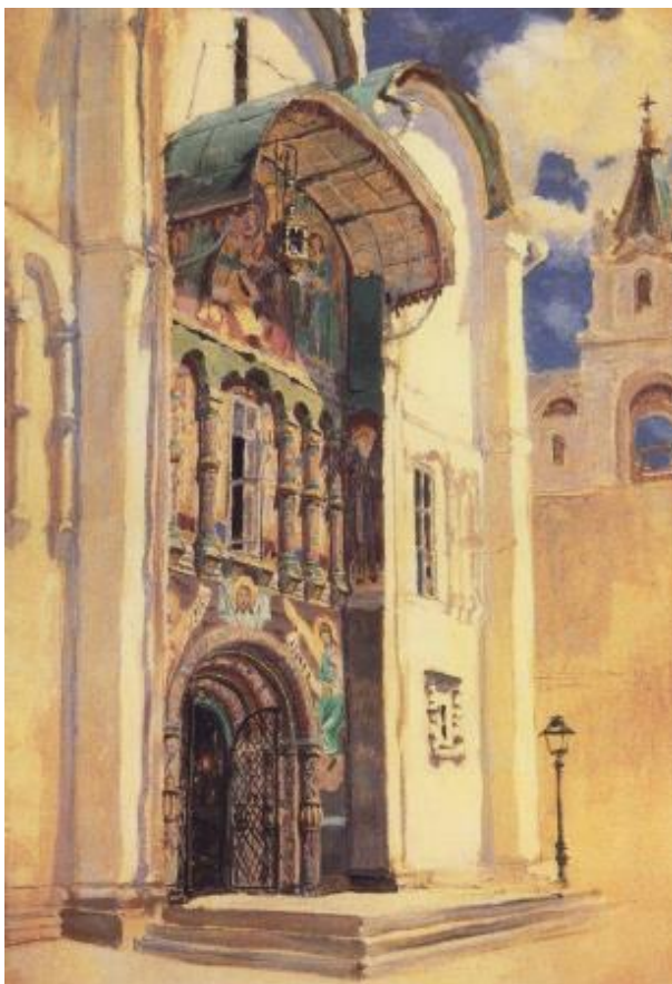
Рис. 2. В.Д. Поленов. Успенский собор. Южные врата. 1877. Холст, масло. 40,7×28. Государственная Третьяковская галерея, Москва