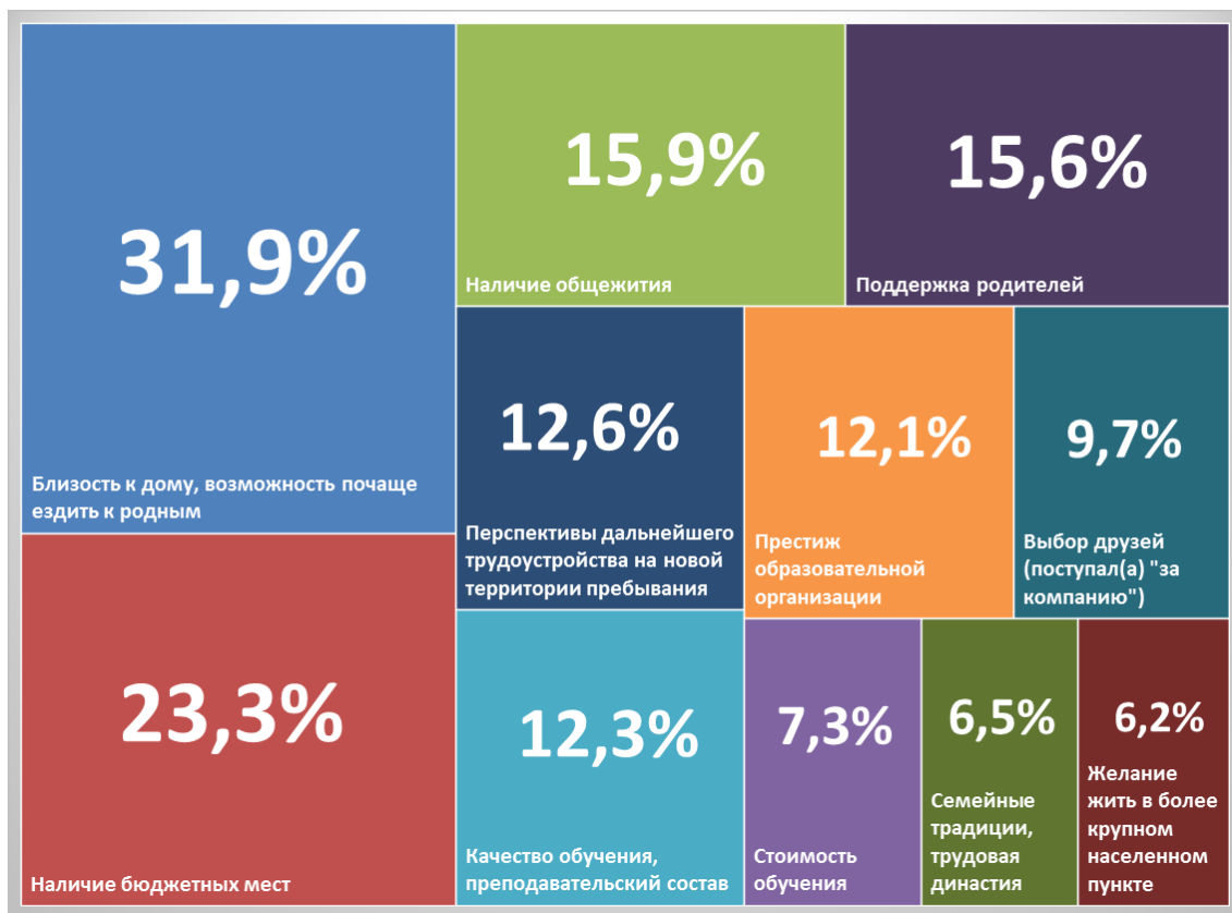
Рис. 1. Основные факторы, влияющие на принятие решения относительно места получения образования (ответы жителей Вологодской области), % от числа опрошенных.