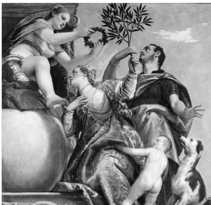
Рис. 2. Произведение искусства «Аллегория любви: Согласие» Паоло Веронезе