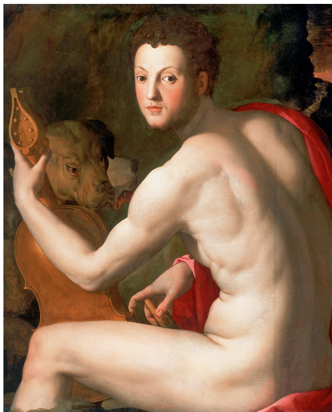
Рис. 3. А. Бронзино, портрет Козимо I в образе Орфея