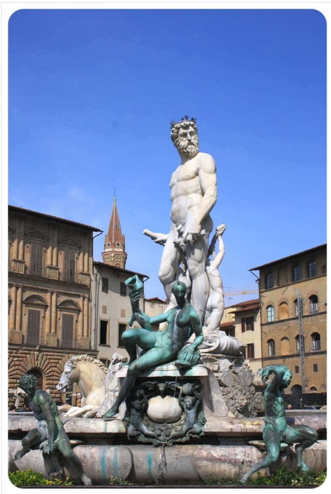
Рис. 4. Б. Амманати, фонтан Нептуна