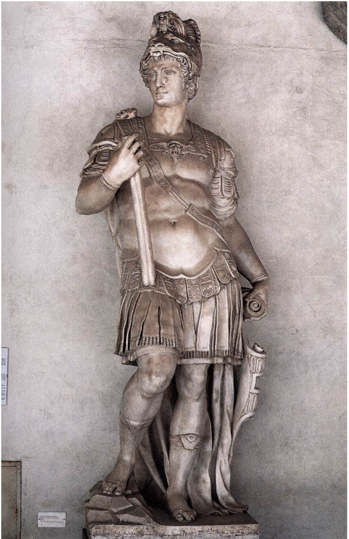
Рис. 2. В. Данти, статуя Козимо I