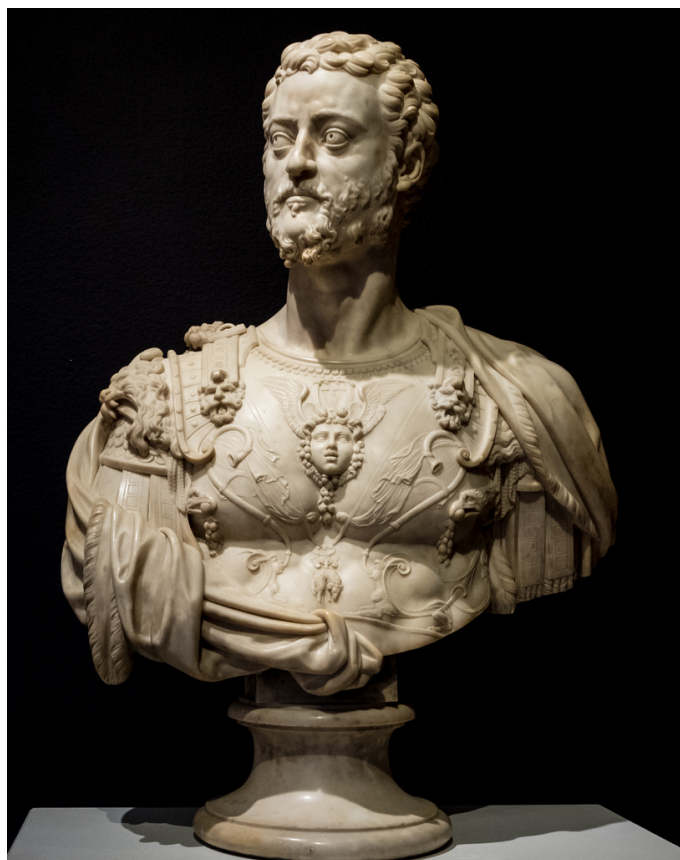
Рис. 1. Б. Челлини, бюст Козимо I