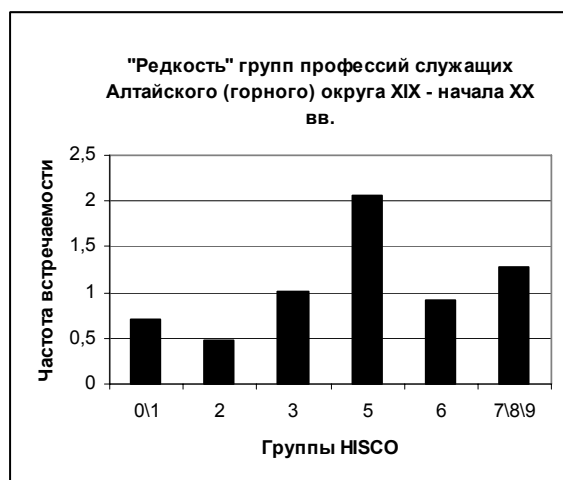
Коэффициент «редкости» групп профессий служащих Алтайского горного округа XIX – начала XX вв.

данной совокупности профессий, коэффициент меньший по значению показывает уникальность определённой группы профессий. Коэффициент «редкости» групп профессий служащих округа представлен на следующем графике и таблице: