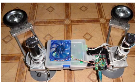
Рис. 2: Фотография прототипа