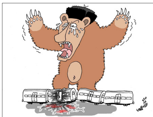
Рис. 3: "Very Upset Putin Russian Bear" (Корейская газета «The Korea Times»)