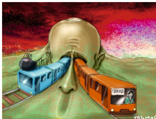
Рис. 4: Бельгийский журнал «Кпакк»