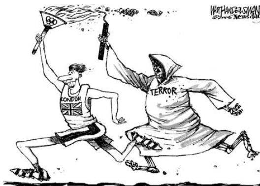
Рис. 5: одна из карикатур, посвященных терактам в Лондоне 2005 года