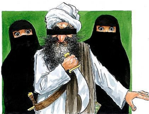
Рис. 1: Одна из карикатур, посвященных пророку Мухаммеду