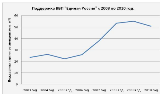
Рис. 1: Рейтинг партии "Единая Россия" с 2003 по 2010 год.