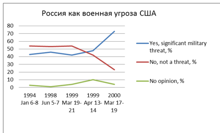
Рис. 3: Рисунок 3