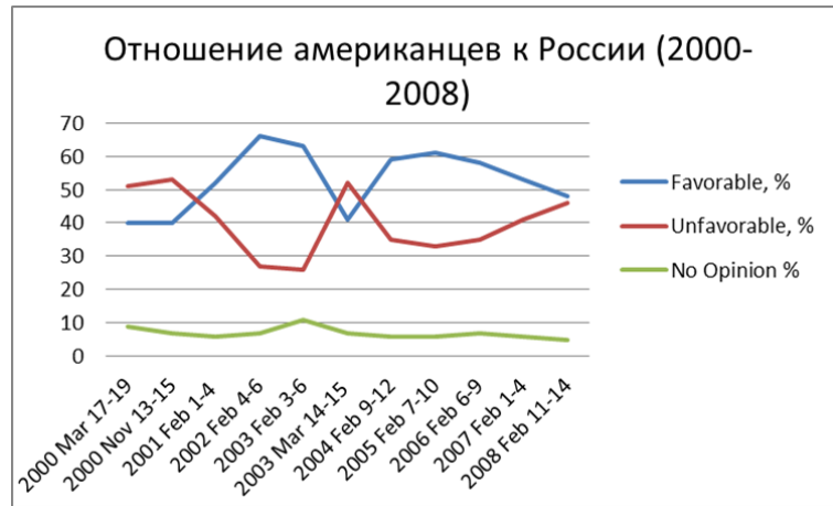
Рис. 2: Рисунок 2