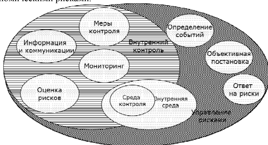
Рис. 2. Система внутреннего контроля и управления рисками согласно концепциям COSO IC и COSO ERM-IF

более детально были определены цели и задачи контроля (рис. 2). Отличительной чертой вышеупомянутых концепций есть ориентация на отслеживание и управление экономическими рисками.