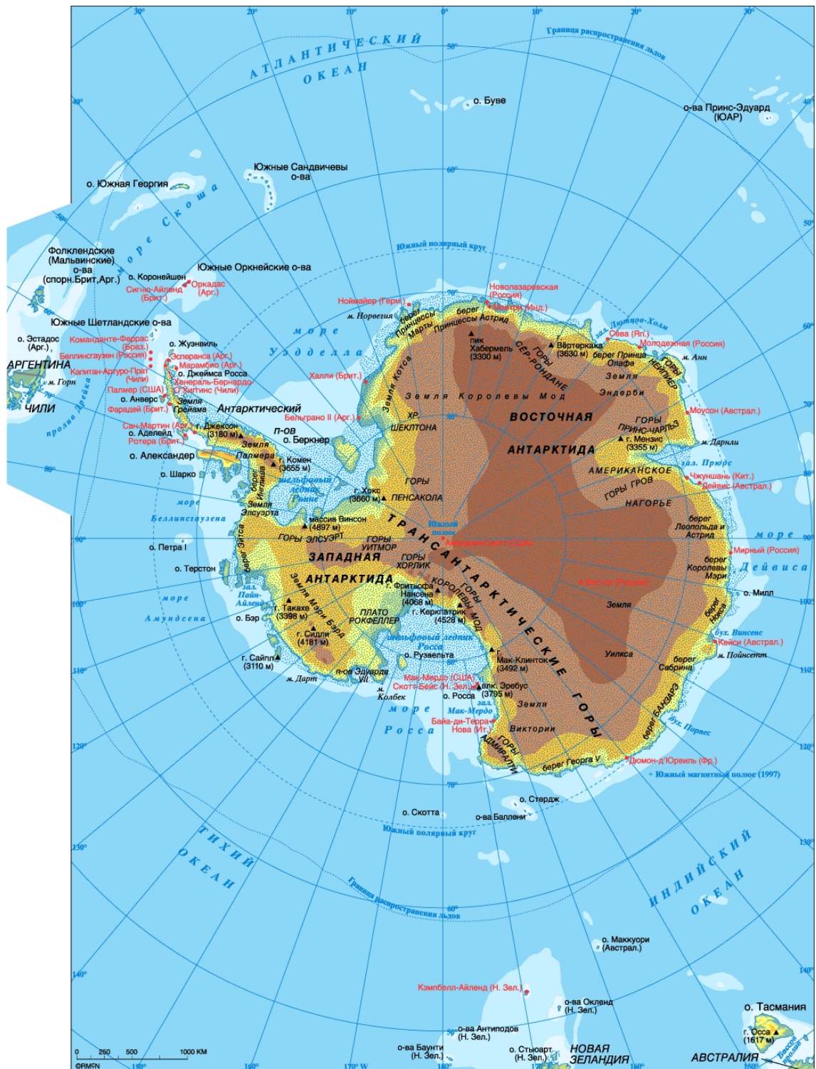
Рис. 3: Антарктика. Физическая карта