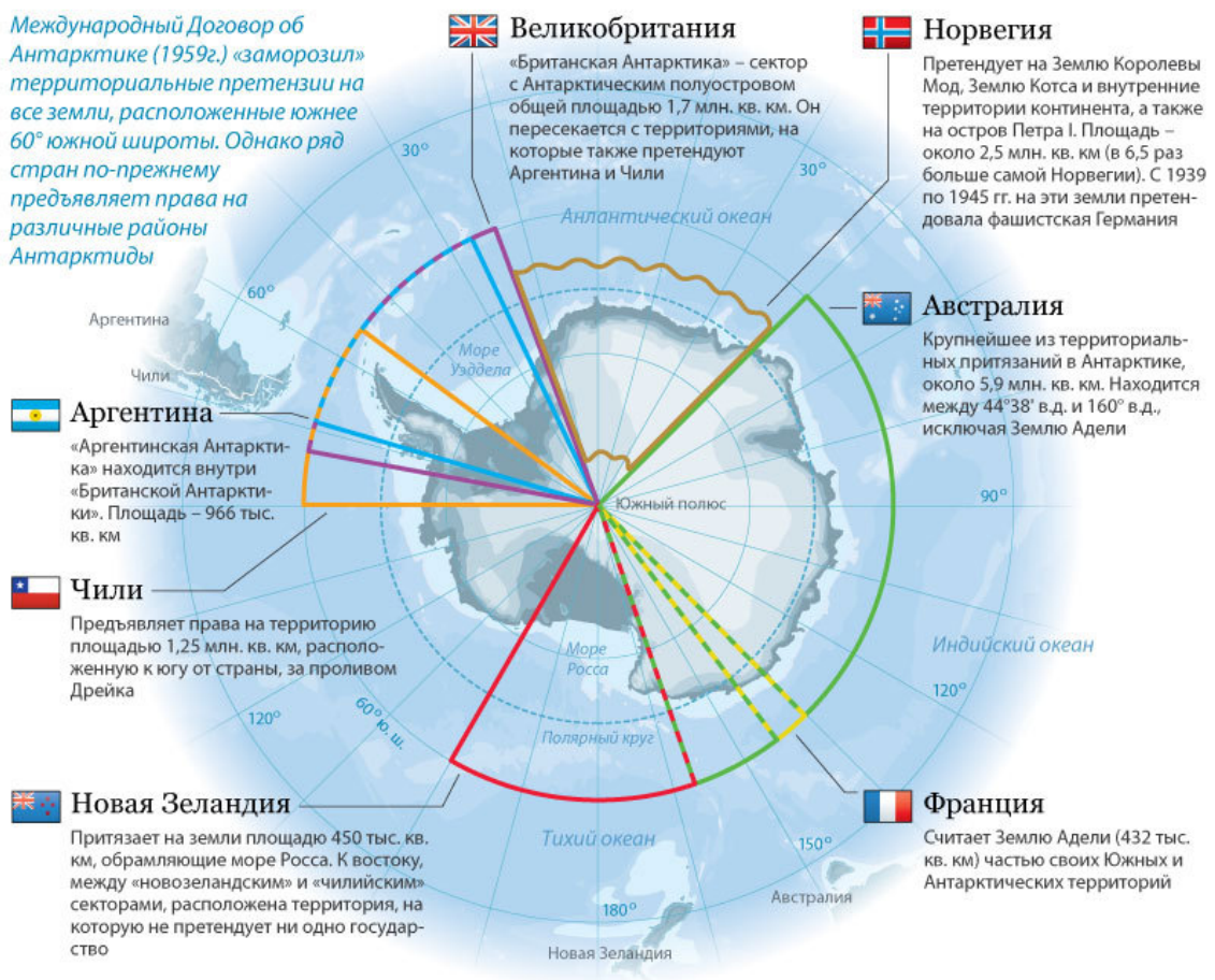
Рис. 2: Территориальные претензии государств в Антарктиде