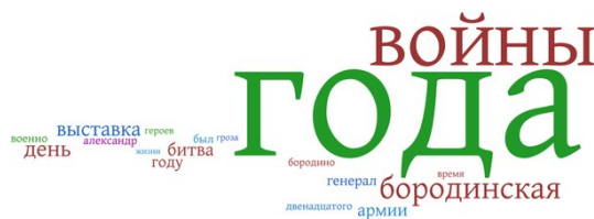
Рис. 2: Рисунок 2. Название поста