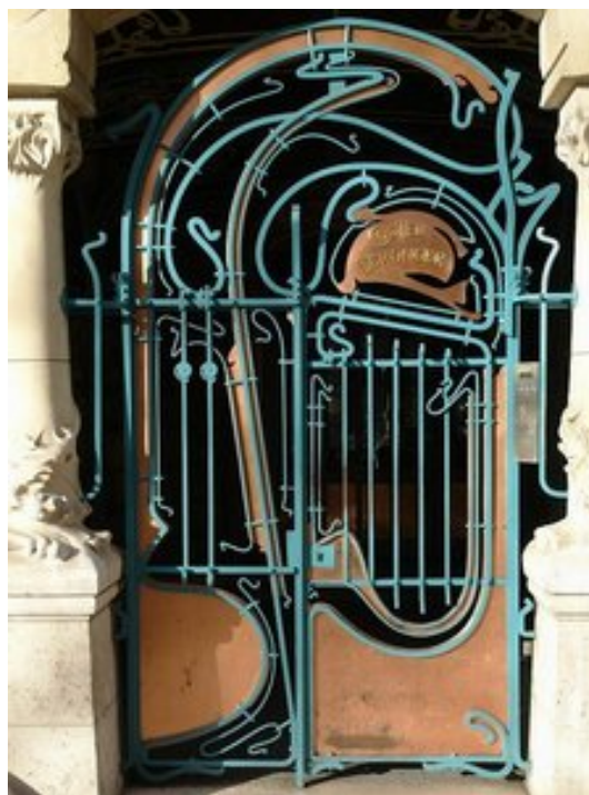
Рис. 5: Эктор Гимар