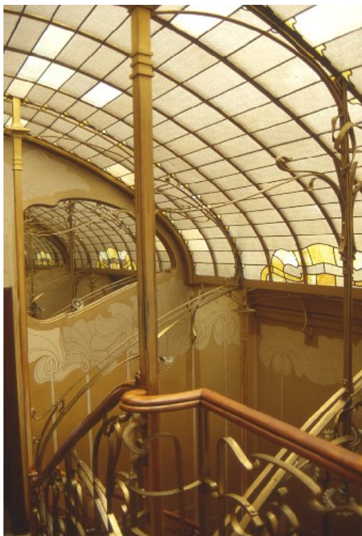
Рис. 2: Виктор Орта