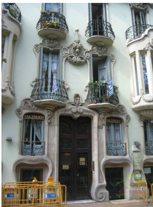
Рис. 8: Антонио Гауди