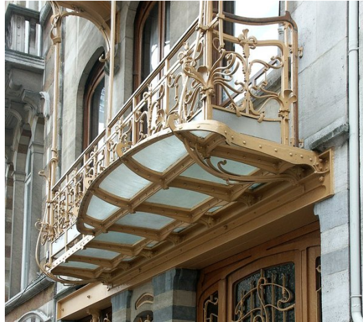
Рис. 6: Виктор Орта