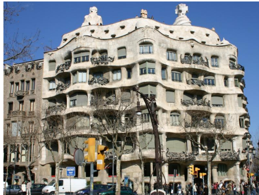
Рис. 7: Антонио Гауди