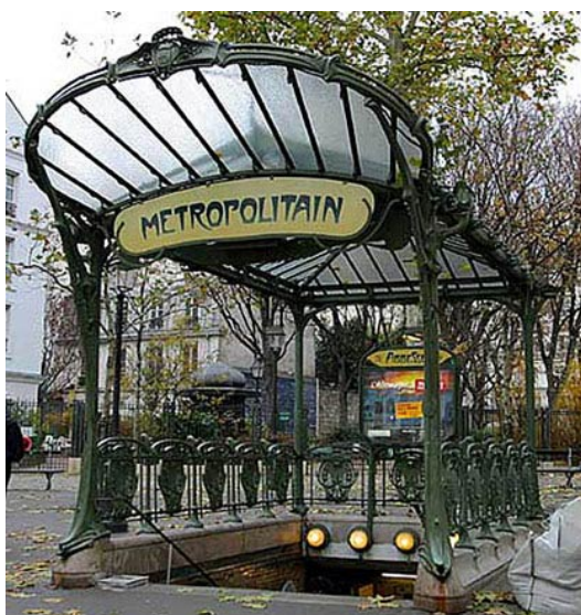
Рис. 3: Эктор Гимар