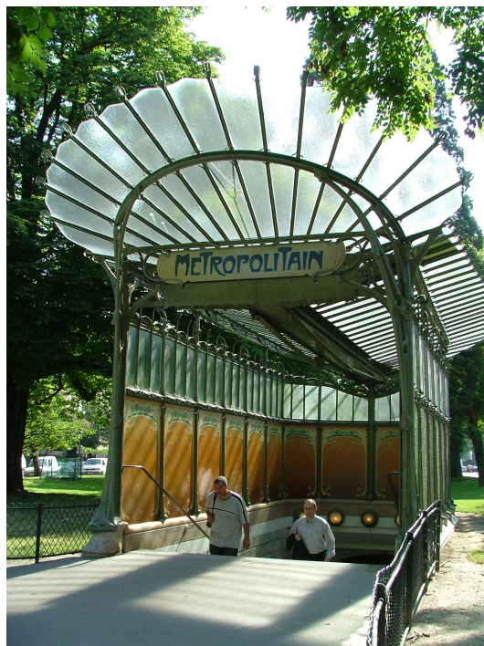
Рис. 4: Эктор Гимар