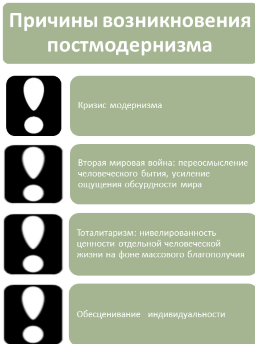
Рис. 1. Причины возникновения постмодернизма