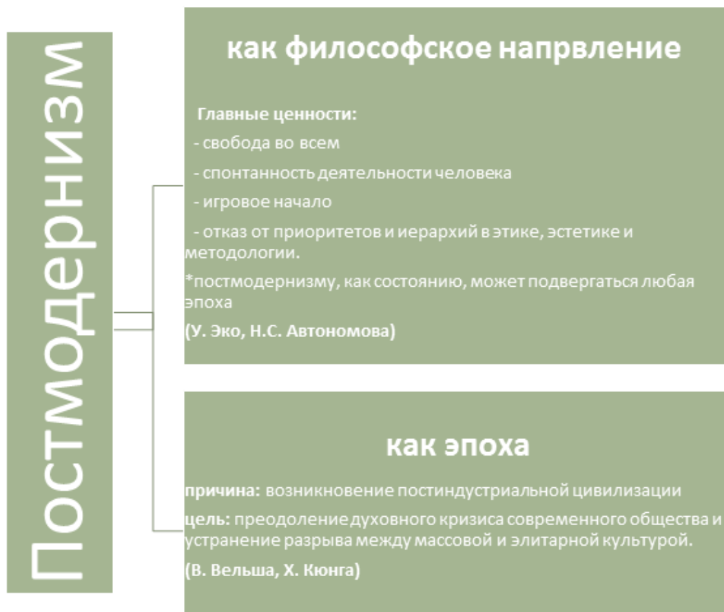
Рис. 2. Постмодернизм, как явление амбивалентное