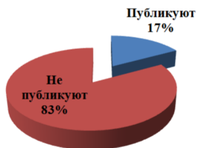
Рис. 2. Рис2.