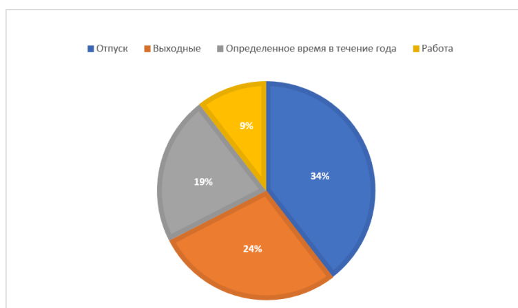
Рис. 1. Преимущественный режим пользования вторым домом в странах Европы.