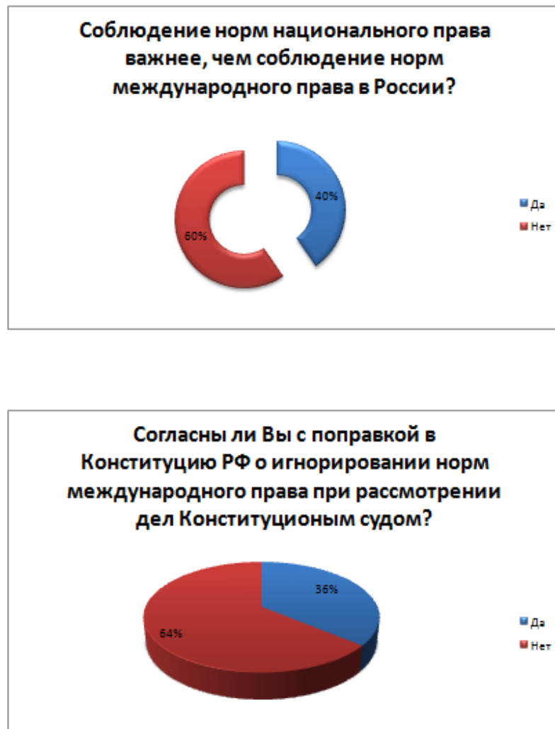
Рис. 2. Опросы, проведённые в сети Instagram, охватом 1000 человек показали следующие результаты: