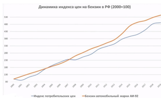
Рис. 1. Динамика индекса цен на бензин в РФ