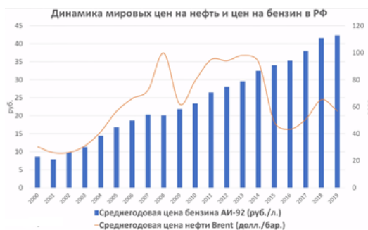
Рис. 2. Динамика мировых цен на нефть и цен на бензин в РФ