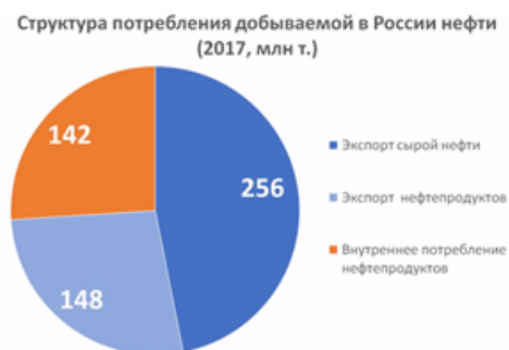
Рис. 4. Структура потребления добываемой в России нефти