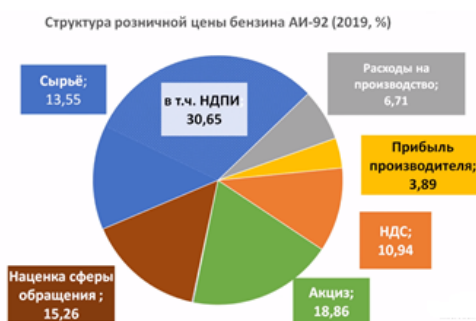
Рис. 3. Структура розничной цены бензина АИ – 92