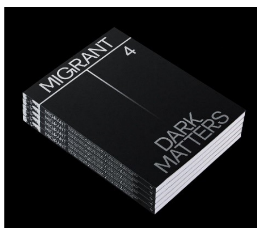
Рис. 3. Рис. 3. Журнал Migrant Journal