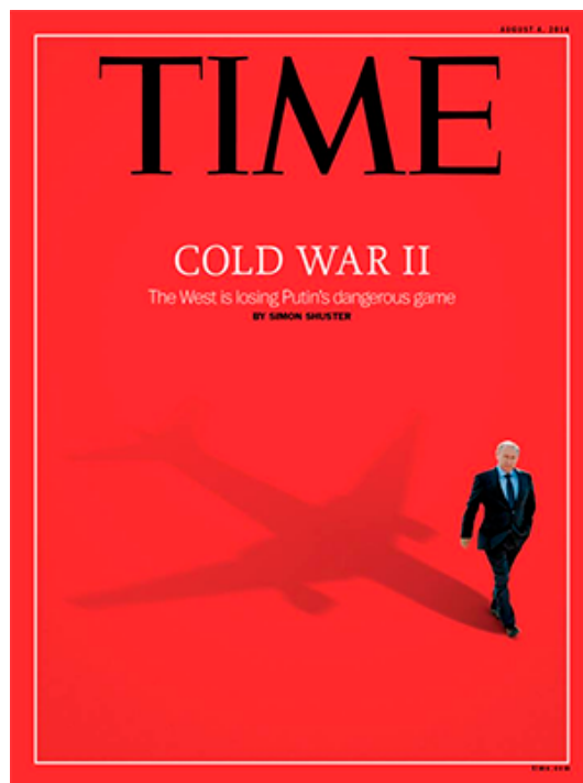
Рис. 5. Рис. 5 Обложка журнала Time