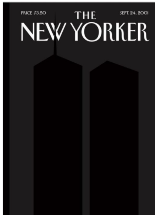
Рис. 4. Рис. 4 Обложка журнала The New Yorker