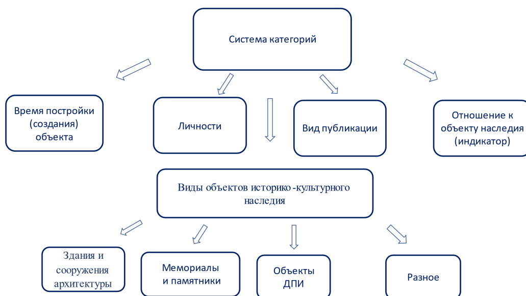
Рис. 2. Система категорий