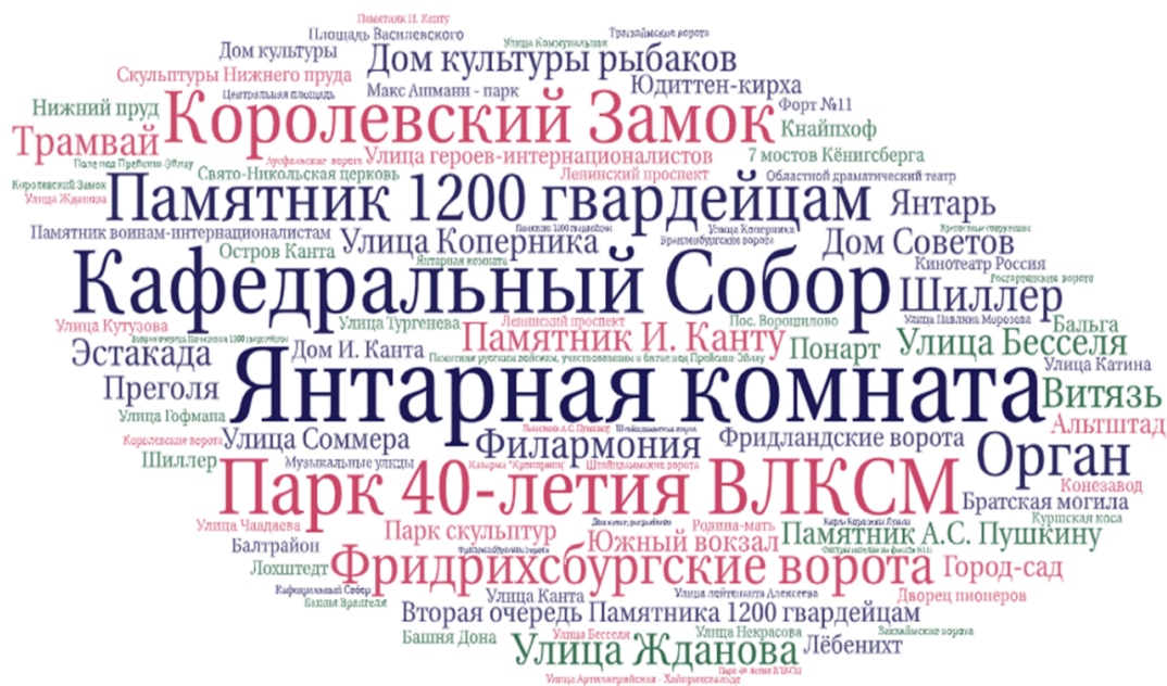
Рис. 4. Категория Объекты историко-культурного наследия