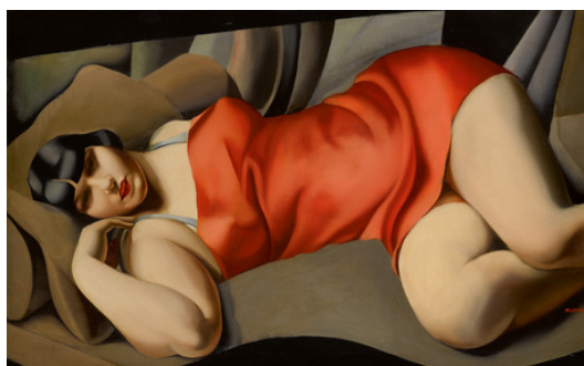
Рис. 2. Тамара де Лемпицка, Розовая туника, 1927