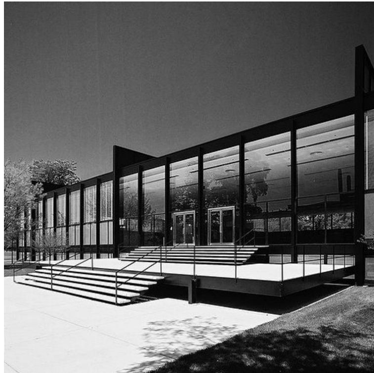
Рис. 3. Людвиг Мис ван дер Роэ. Краун Холл. 1950 – 1956 гг. Чикаго, Иллинойс, США. Общий вид.