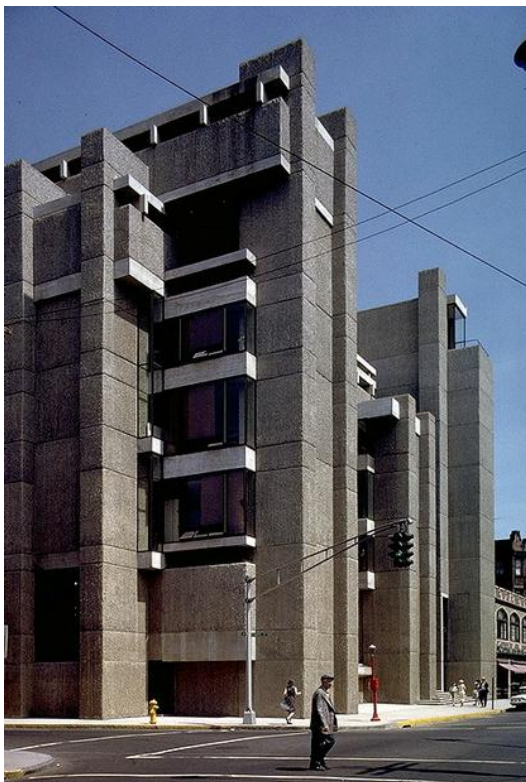
Рис. 1. Пол Рудольф. Корпус архитектуры и искусств Йельского университета. 1958 – 1963 гг. Коннектикут, США. Общий вид.