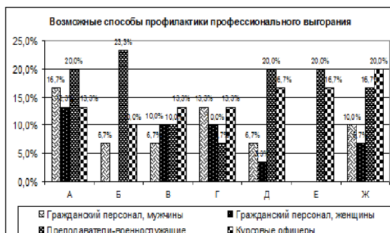
Рис. 2. Предложения респондентов по профилактике профвыгорания