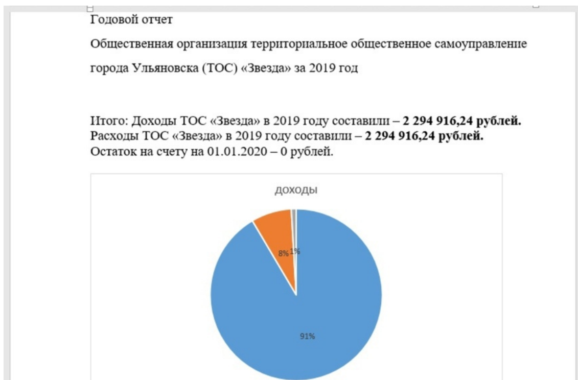
Рис. 1. 1 файл