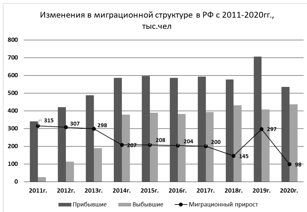
Рис. 2. Рисунок 2.