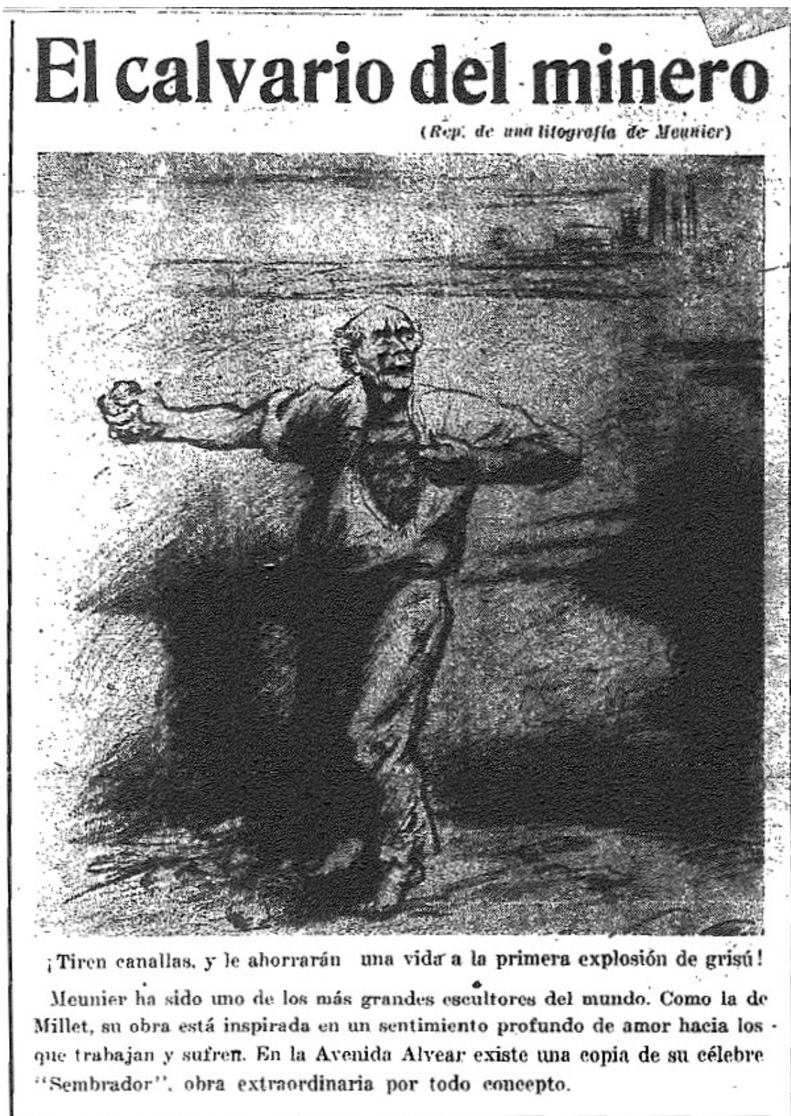
Рис. 1. Эдуар Кутюрье. «Мучение шахтера» («El calvario del minero»). Фотокопирование, дополнение газеты La Protesta. 16 октября 1922 г. Vol. 1. № 39. P. 1.