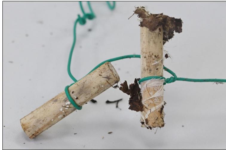
Рис. 1. Общий вид чопиков, экстрагированных после периода разложения в лесной подстилке в течении 2-х месяцев.