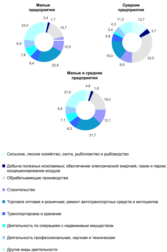
Рис. 2. Распределение субъектов МСП по видам экономической деятельности в 2022 году