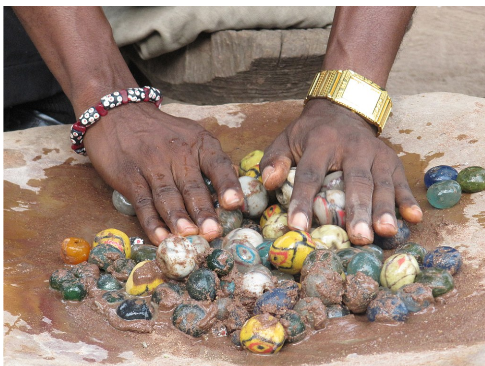
Рис. : Процесс шлифовки бусин