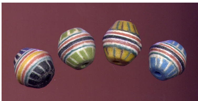
Рис. : Составная бусина Кробо