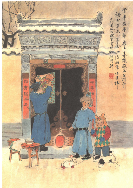
Рис. : Рис 3. Парные надписи с новогодними пожеланиями