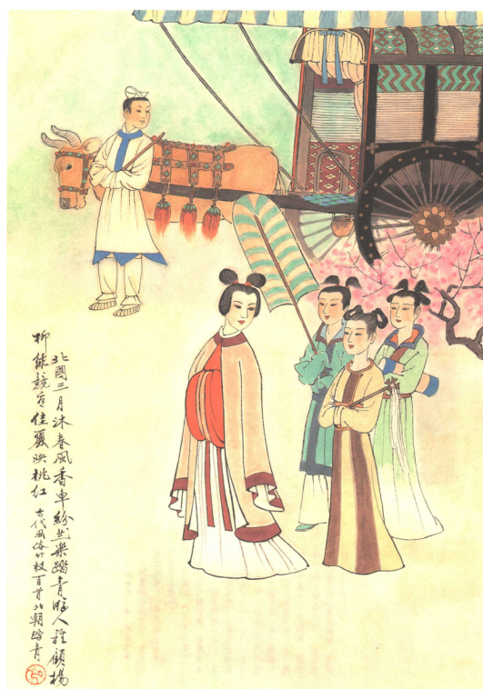
Рис. : Рис 5. Совершить прогулку на лоне природы