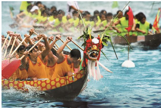
Рис. : Рис 6. Состязания на драконьих лодках