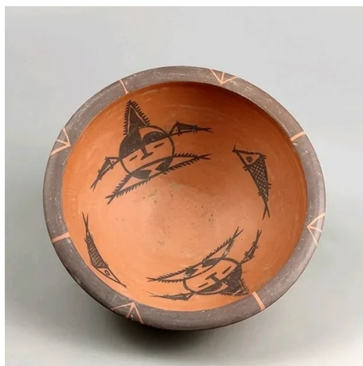
Рис. : Рис 1.Орнамент фигуры и рыбы-Цветная керамика Культура Яншао существовал на территории Китая в V—II тыс. до н. э.