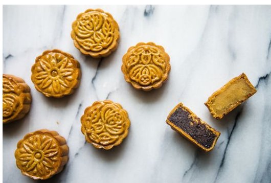
Рис. : Рис 7. Лунные пряники