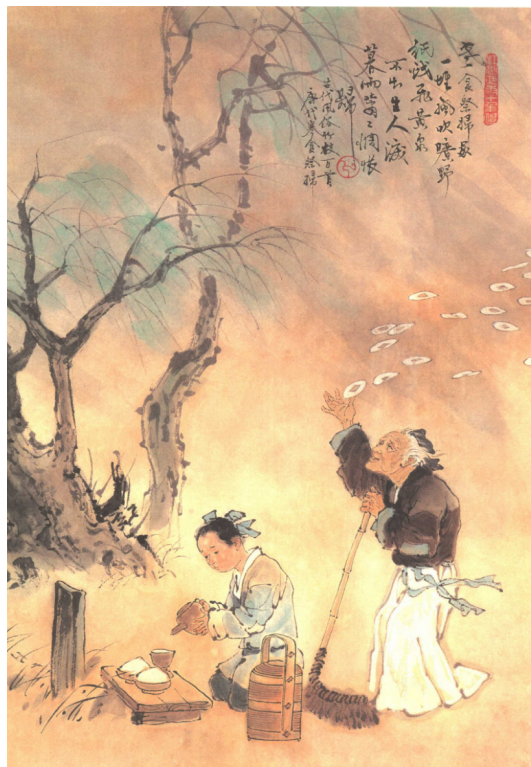
Рис. : Рис 4. Приносить жертвы предкам