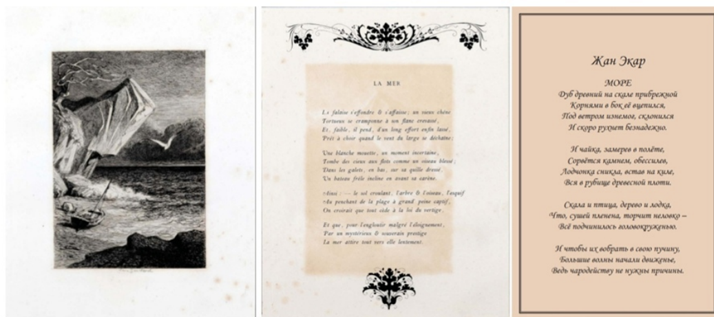
Рис. : 1. Л. Гошерель. Море. По мотивам сонета Ж. Экара. 1868. Бумага Верже, офорт