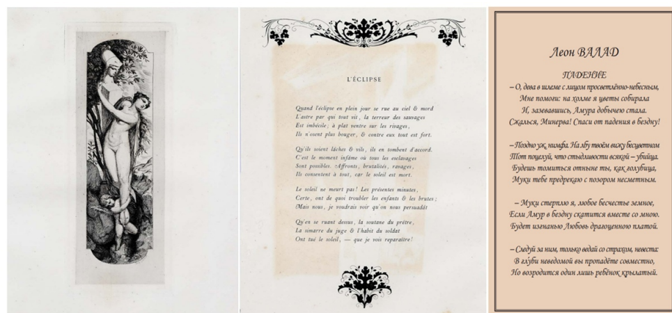
Рис. : 4. М. Солон. Падение. По мотивам сонета Л. Валада. 1868. Бумага Верже, офорт