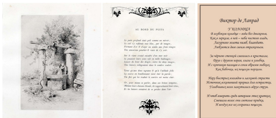
Рис. : 2. Франсуа-Луи Франсэ. У колодца. По мотивам сонета В. де Лапрада. 1868. Бумага Верже, офорт