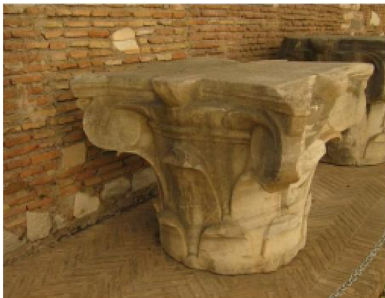
Рис. 7. Композитная капитель Сан-Паоло-фуори-ле-мура. 380-е гг. Рим.