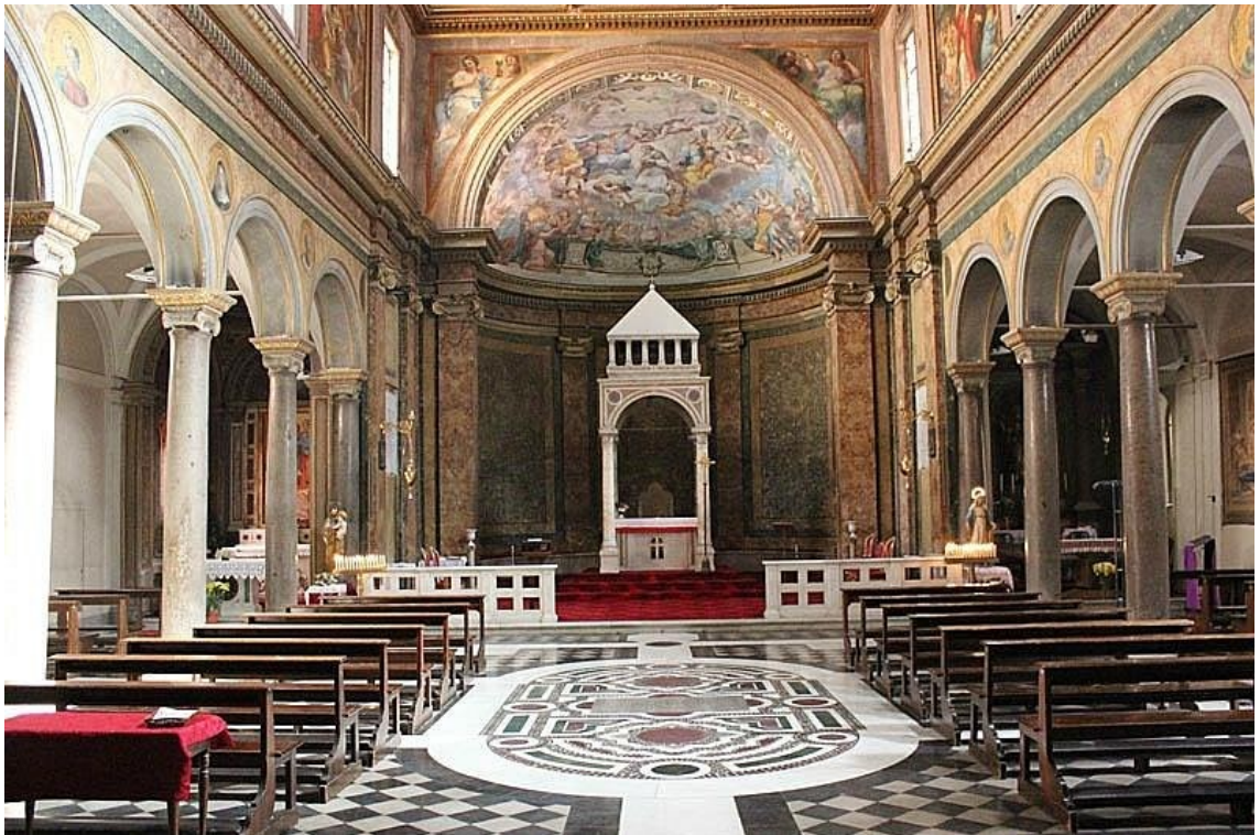
Рис. 6. Санта-Агата-деи-готи. Сер. V в. Рим.