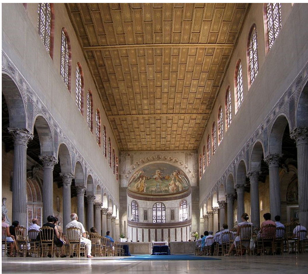
Рис. 4. Санта-Сабина. Конец 420 – начало 430 гг. Рим.