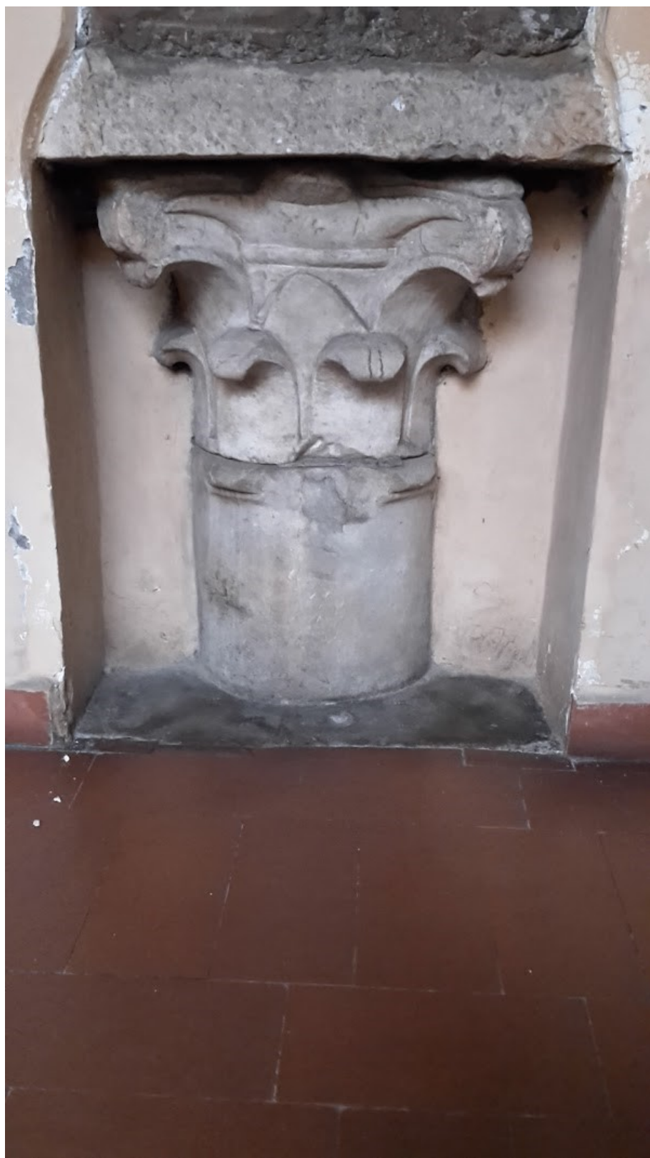
Рис. 3. Капитель церкви Сан-Систо-Веккьо. Кон IV в. Рим.