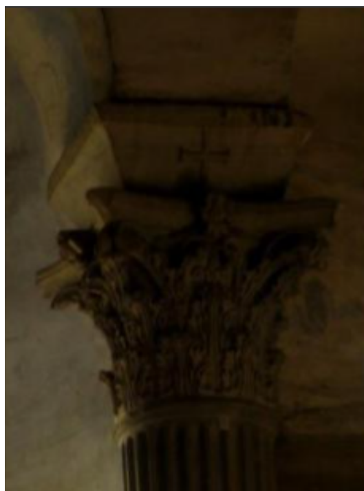
Рис. 8. Пульвана с изображением креста в Санто-Стефано-Ротондо. 460-480 гг. Рим.