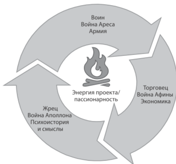
Рис. : Модель геостратегического актора [2]