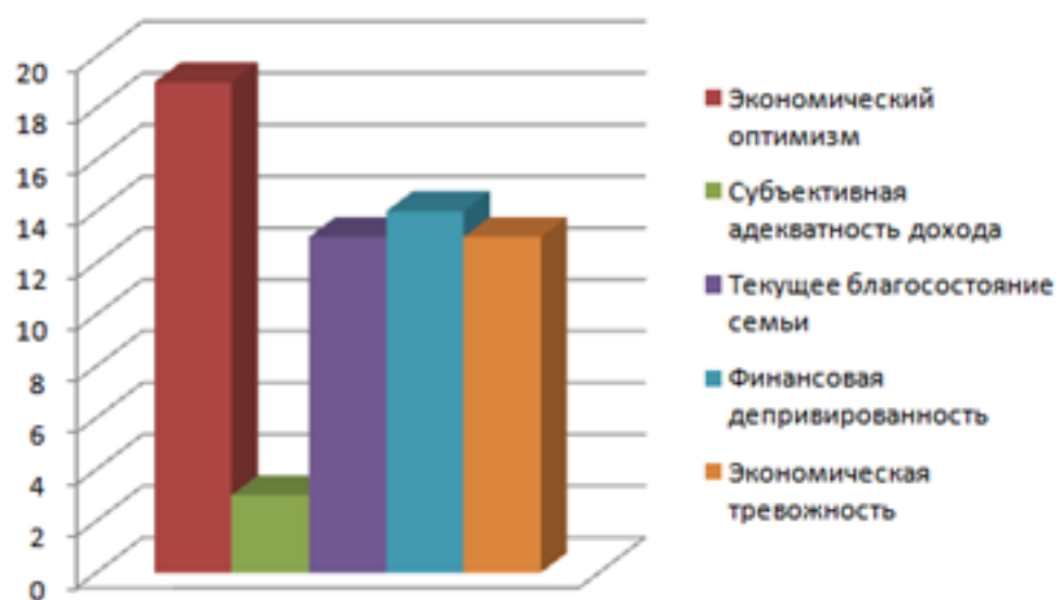
Рис. : Средние значения категорий субъективно-экономического благополучия молодежи.