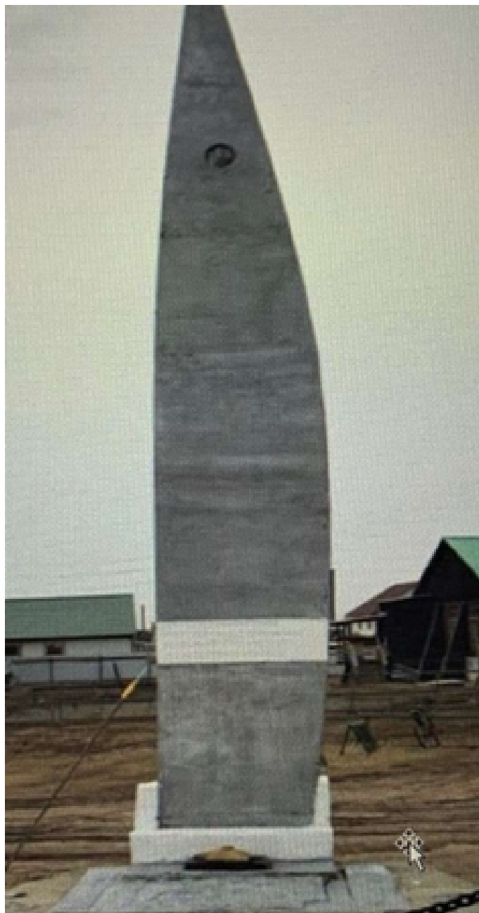
Рис. : Стела