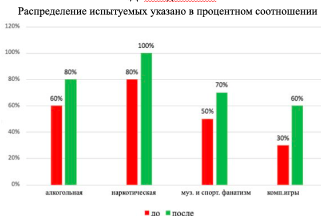
Сравнительные результаты исследования склонности к зависимому поведению по тесту «Склонность к зависимому поведению» В.Д. Менделевича

Рис. : Сравнительные результаты исследования склонности к зависимому поведению по тесту «Склонность к зависимому поведению» В.Д. Менделевича (распределение испытуемых указано в процентном соотношении)