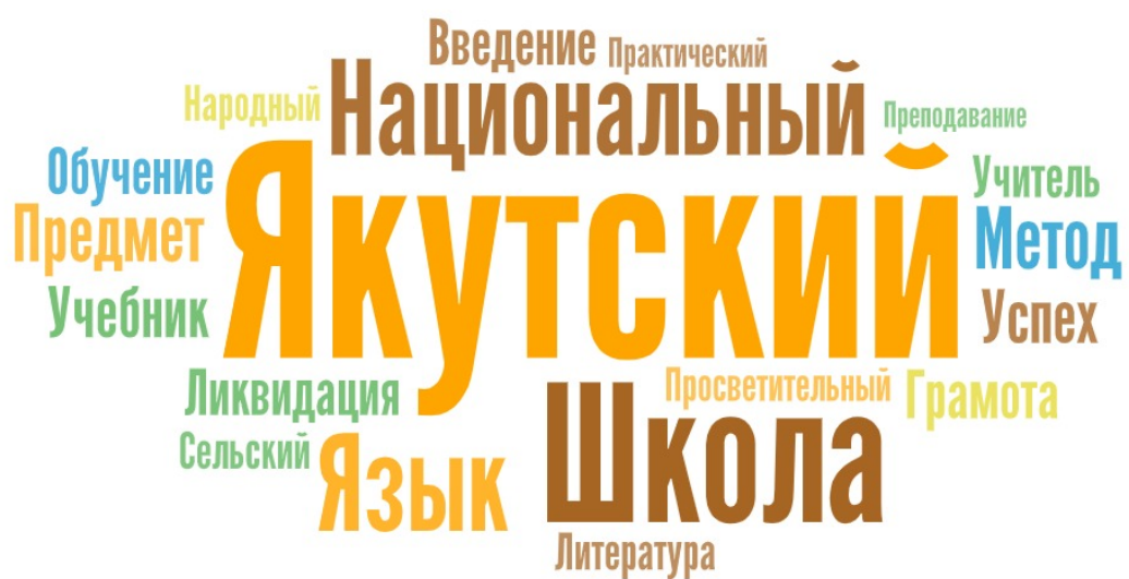
Рис. : 2. Смысловые единицы категории "Школа".