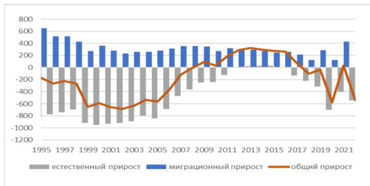
Рис. : рис. 1. Декомпозиция общего прироста численности населения в России за 1995-2022 гг., тыс. чел.