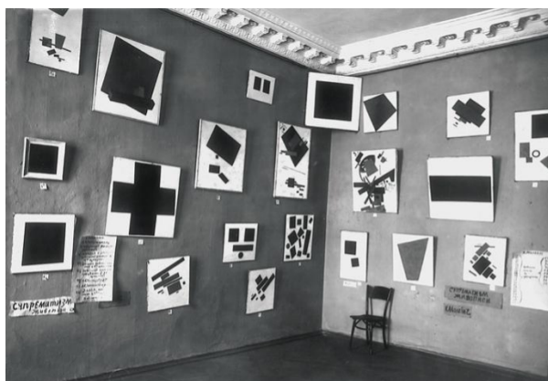
Рис. : выставка "0.10"