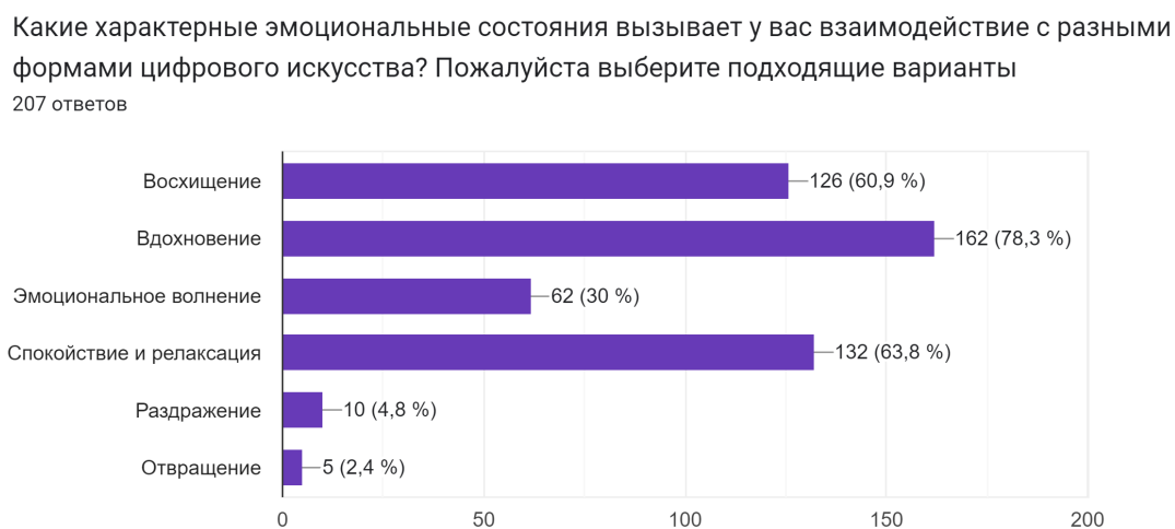
Рис. : Рисунок 2: Ответы респондентов на вопрос «Какие характерные эмоциональные состояния вызывает у вас взаимодействие с разными формами цифрового искусства?»