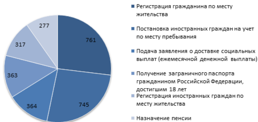
Рис. : Распределение досудебных жалоб, поданных за декабрь 2023 г.