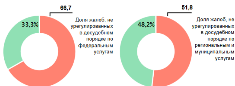
Рис. : Результат урегулирования жалоб в досудебном порядке за первый квартал 2023 г.