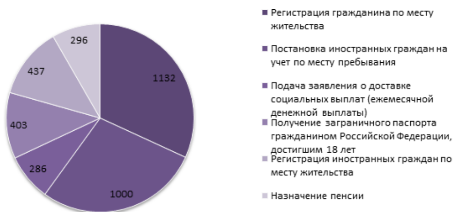
Рис. : Распределение досудебных жалоб, рассмотренных за декабрь 2023 г.