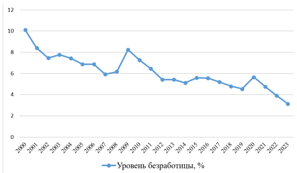
Рис. : Рисунок 1. Динамика изменения уровня безработицы в РФ по годам в период с 2000 по 2023 гг. в %