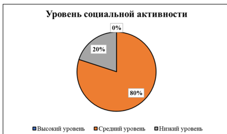
Рис. : Уровень социальной активности