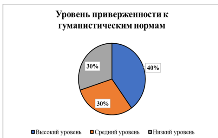
Рис. : Уровень приверженности воспитанников гуманистическим нормам жизнедеятельности (нравственности)