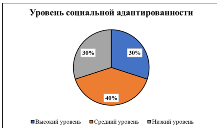
Рис. : Уровень социальной адаптированности