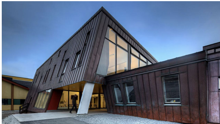
Рис. : Рисунок 2