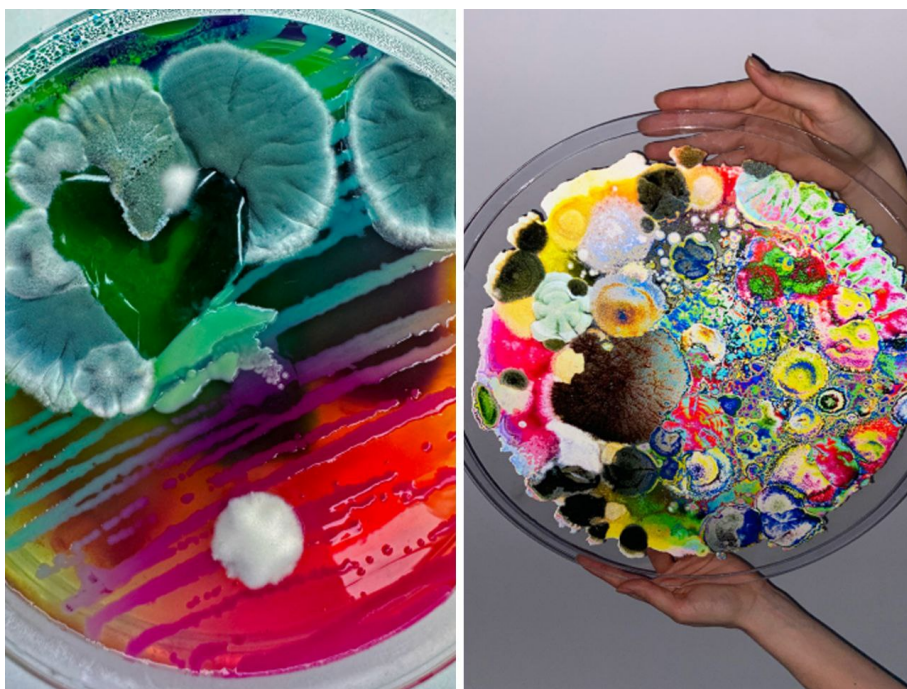
Рис. : Рисунок 1