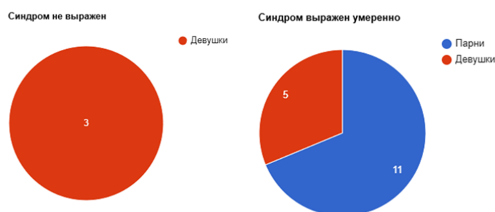
Рис. : Синдром не выражен / выражен умеренно