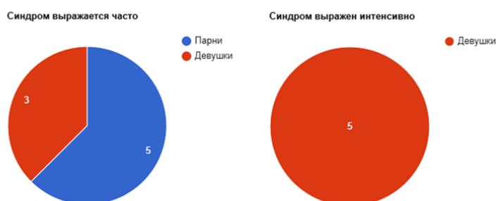
Рис. : Синдром выражается часто / выражен интенсивно