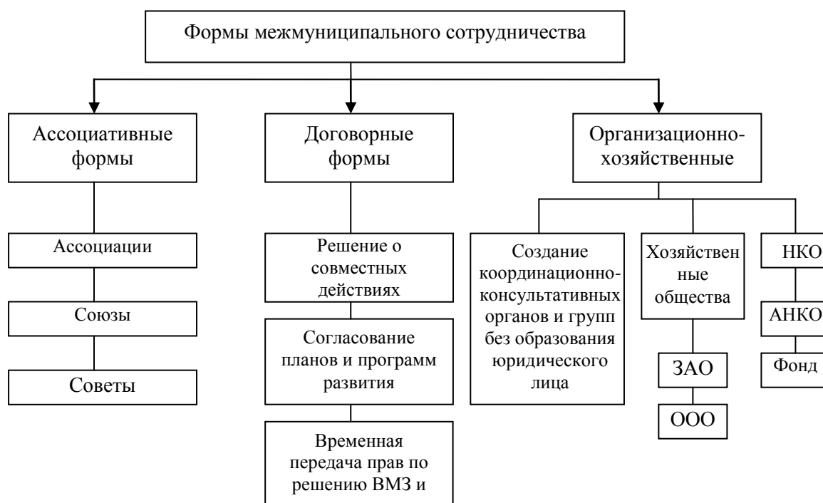
Рис. 1. Типы форм межмуниципального сотрудничества в РФ