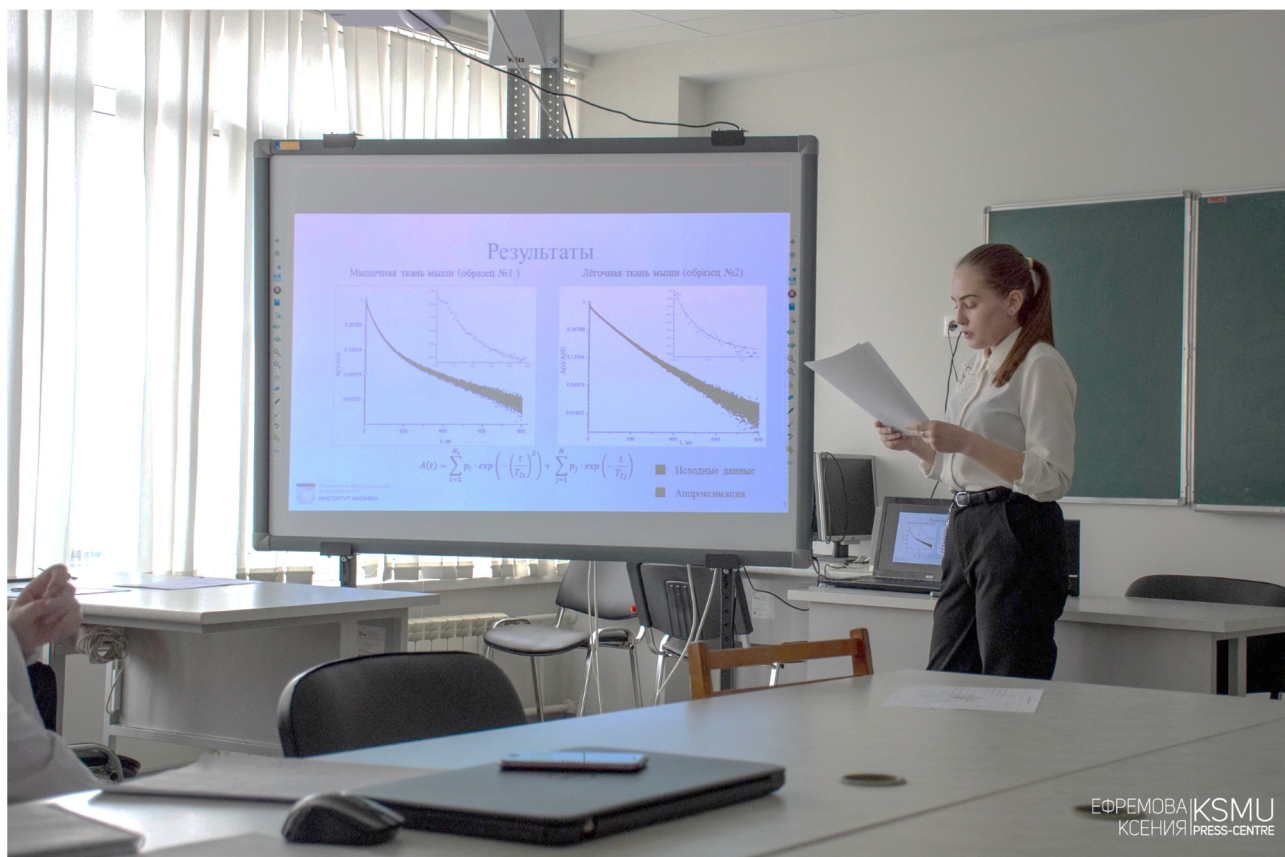
Рис. 4. Представление результатов исследования