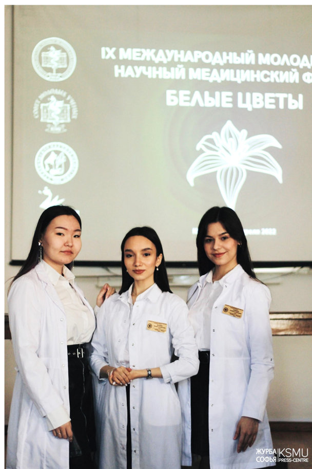
Рис. 2. Выступление на форуме "Белые цветы"