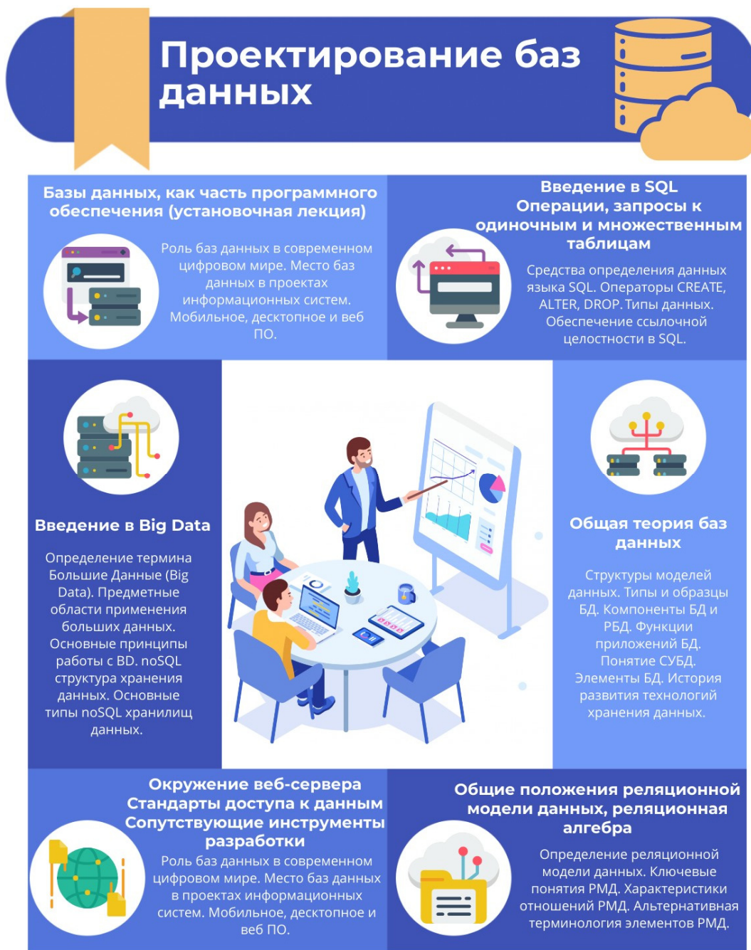
Рисунок 3 – Краткое содержание дисциплины (инфографика)