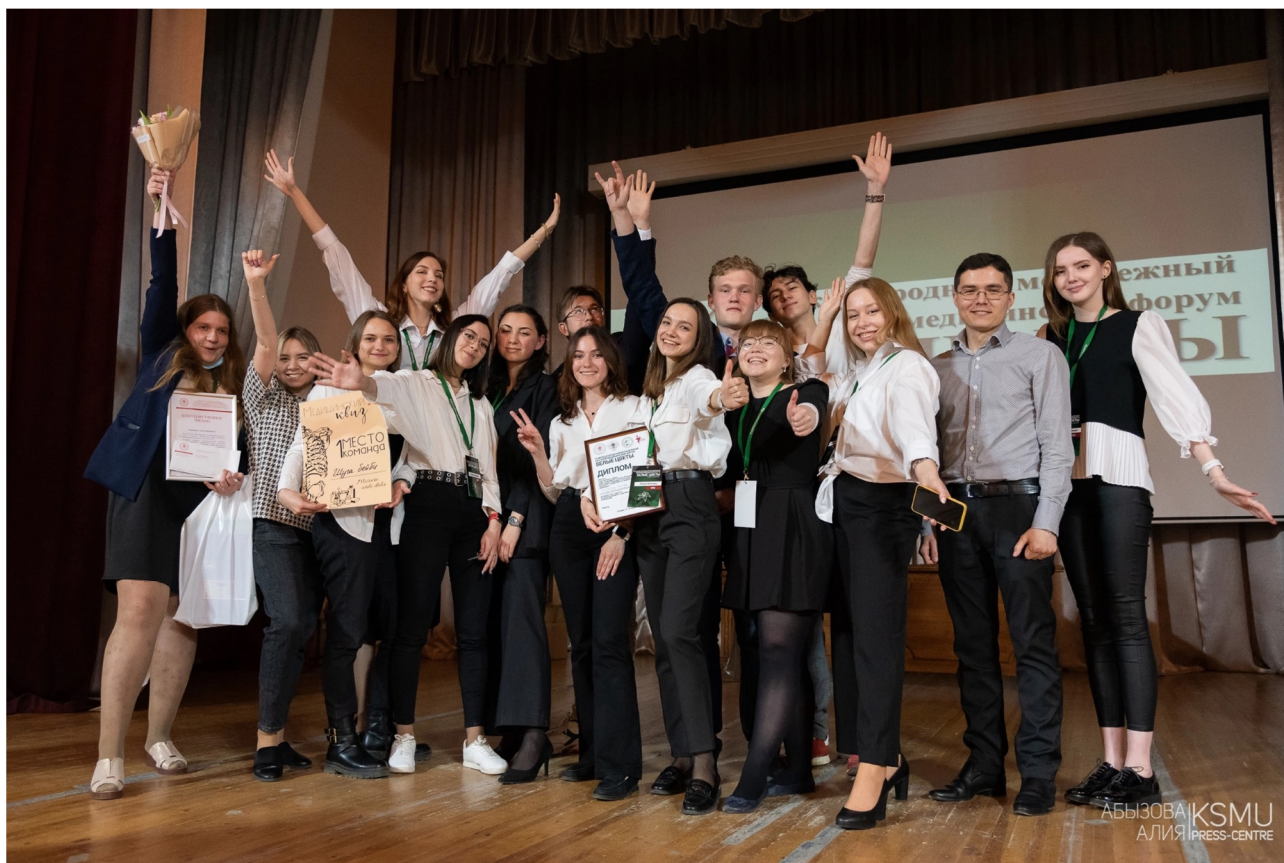
Рис. 1. Торжественное закрытие форума