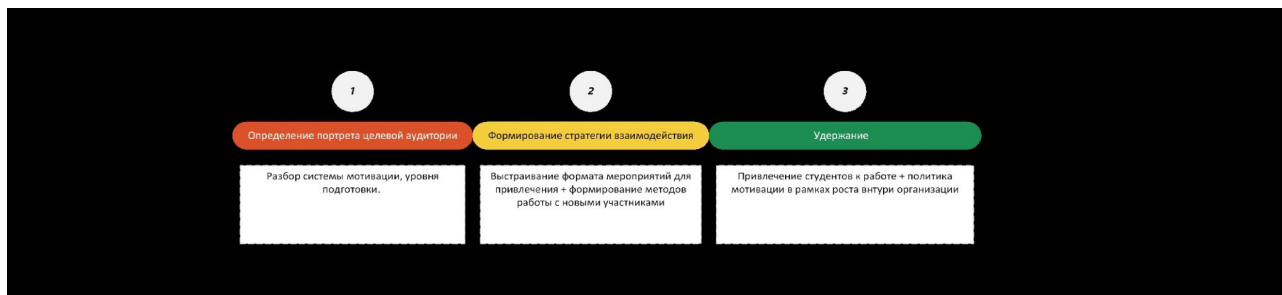
Рис. 1. Схема взаимодействия со студентами внутри СНО СПбГУ.