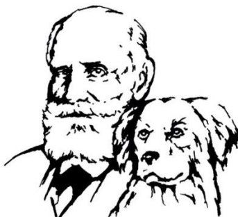
Рисунок 1 – Эмблема конференции