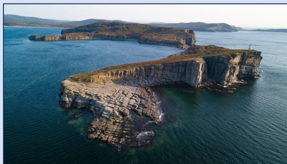
10. Мыс Тобизина (о-в Русский)