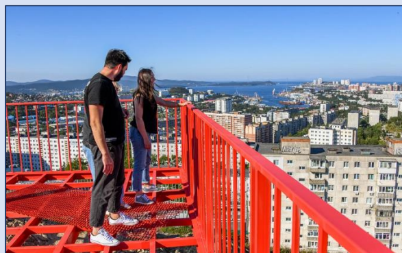
2. Смотровая площадка на сопке Бурачка