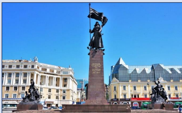
1. Площадь Борцов за власть Советов