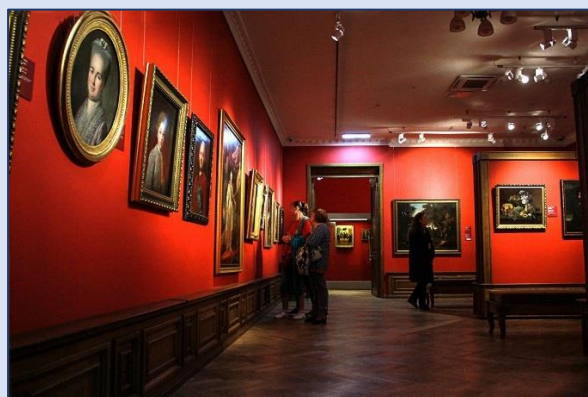
14. Приморская государственная картинная галерея (Алеутская улица, 12)