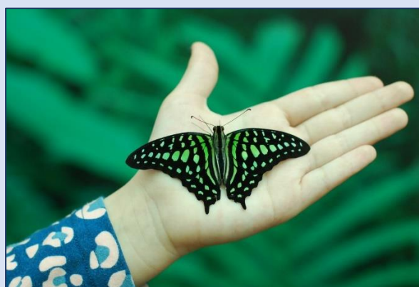
16. Дом бабочек «Восторг» (Батарейная улица, 4)