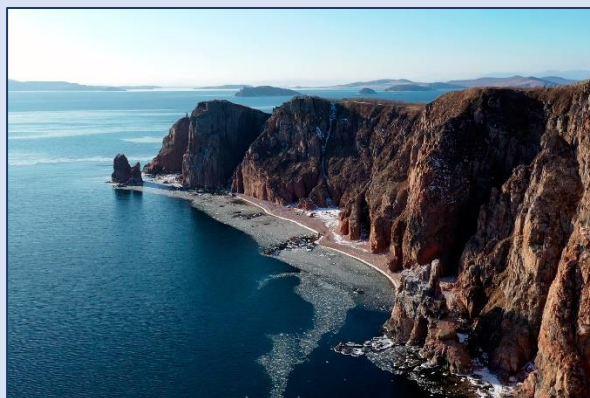
8. Остров Шкота