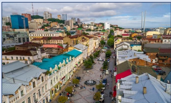
5. Владивостокский Арбат