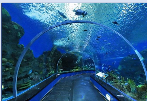
15. Приморский океанариум (улица Академика Касьянова, 25)