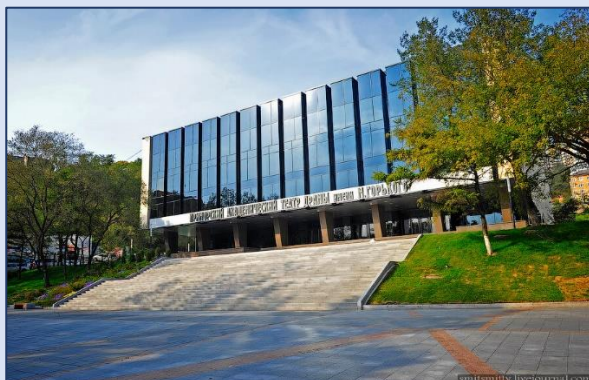
11. Приморский академический краевой драматический театр имени М. Горького (Светланская улица, 49)