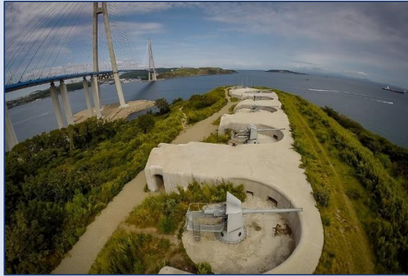
17. Новосильцевская батарея (посёлок Поспелово, 13)