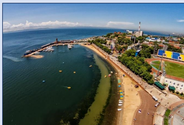
4. Набережная Спортивной гавани