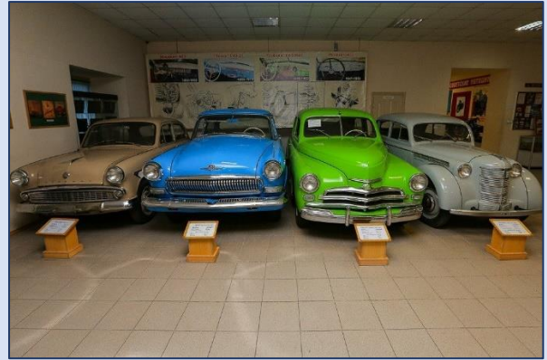
18. Музей автотостарины (Сахалинская улица, 2а)