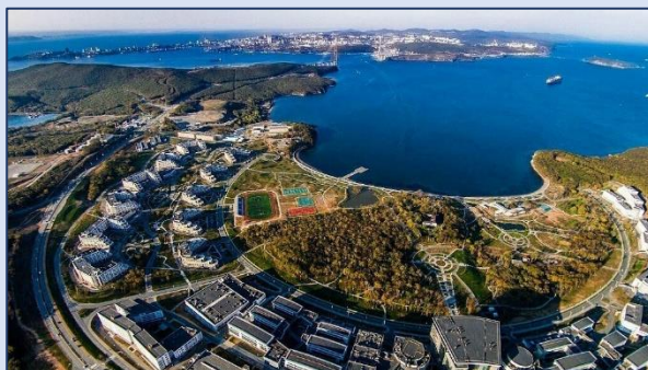
9. Бухта Аякс (о-в Русский)