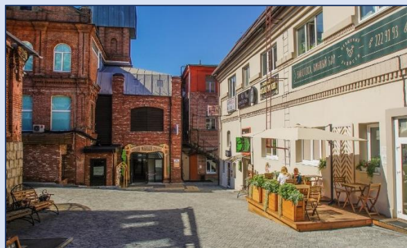
6. Старый дворик ГУМа