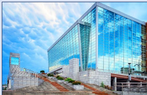
12. Приморская сцена Мариинского театра (Фастовская улица, 20)