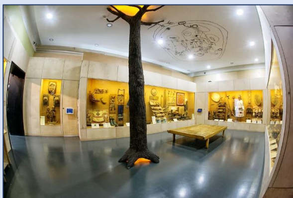
13. Музей истории Дальнего Востока имени В. К. Арсеньева (Светланская улица, 20)