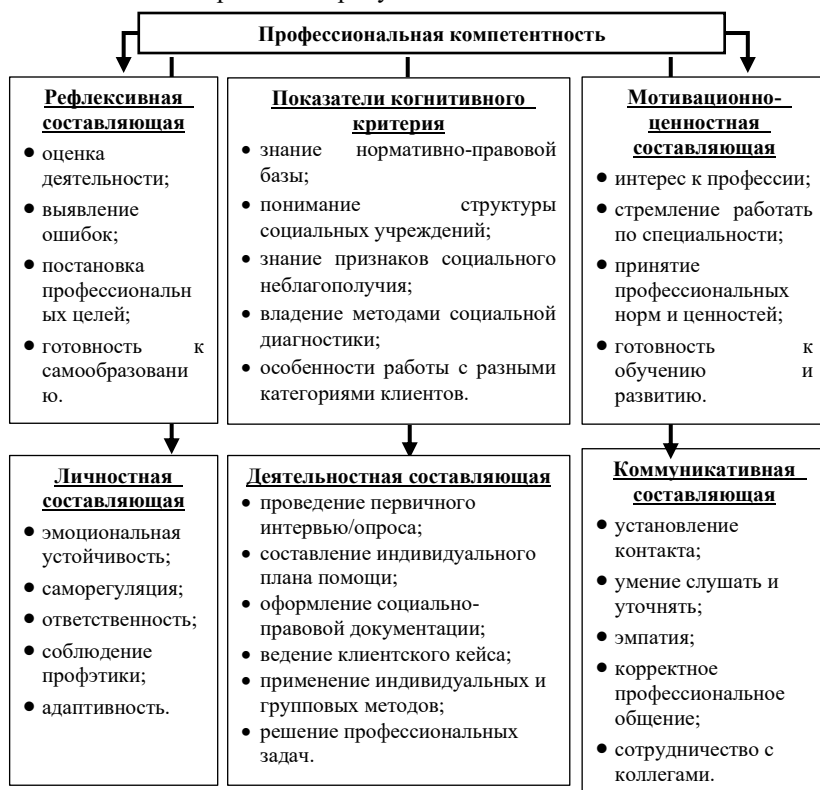
Рис. 1 – Структура профессиональной компетентности социального работника

которого общество и человек формируют представление о конкретном виде занятий как о профессии (социологический подход) [3]. Рассматривая профессиональное становление через призму обозначенных подходов применительно к социальной работе, можно говорить о том, что профессиональное становление – многокомпонентный процесс, включающий когнитивный, мотивационный, практический и личностно-ценностный аспекты, где в качестве центрального элемента выступает профессиональная компетентность, подразумевающая под собой не только владение технологией социальной работы, но и наличие устойчивых гуманистических ценностей, направленных на оказание помощи людям [4]. Внутренне наполнение (структура) профессиональной компетентности отражена на рисунке 1.