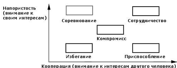
Рис.1 – «Сетка» Томаса-Килманна

Модель Томаса-Килманна оценивает поведение человека в конфликтах по двум основным параметрам: напористость – степень, в которой человек пытается удовлетворить свои собственные интересы, и готовность к сотрудничеству (кооперация) – степень, в которой человек пытается удовлетворить интересы другого человека [4]. Эти два параметра поведения можно использовать для определения пяти стратегий поведения в конфликтных ситуациях: соревнование или конфронтация, избегание, приспособление, компромисс и сотрудничество (Рисунок 1).